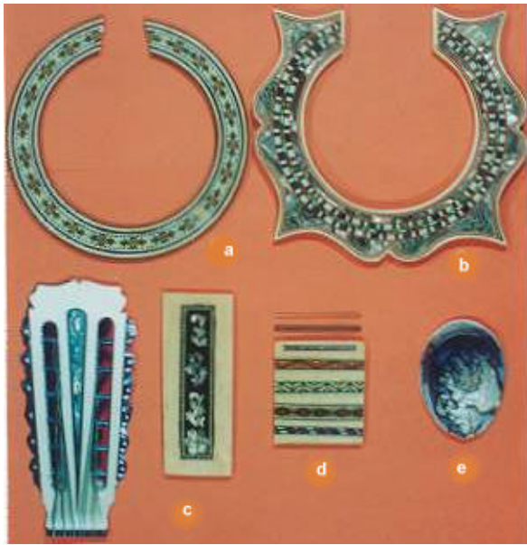
Fig. 5. Adornos. a. Roseta de madera. b. Roseta de concha de abulón. c. Palma. d. Hilos y filetes. e. Concha de abulón.

En la tapa, que se considera la parte acústica más importante de la guitarra se utiliza madera de conífera con anillos de crecimiento de anchura uniforme, alrededor de dos milímetros de ancho. Se usa Picea sitchensis (Sitka spruce, Abeto) y Thuja plicata (Western redcedar) ambas de importación.