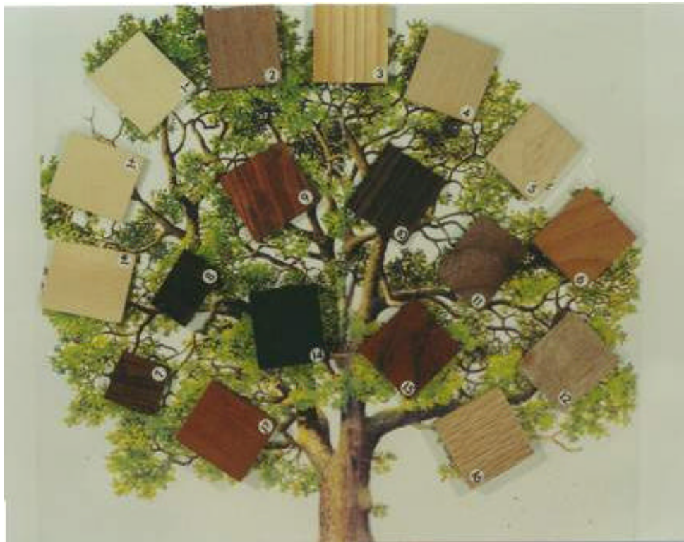
Fig. 6. Características de la madera.