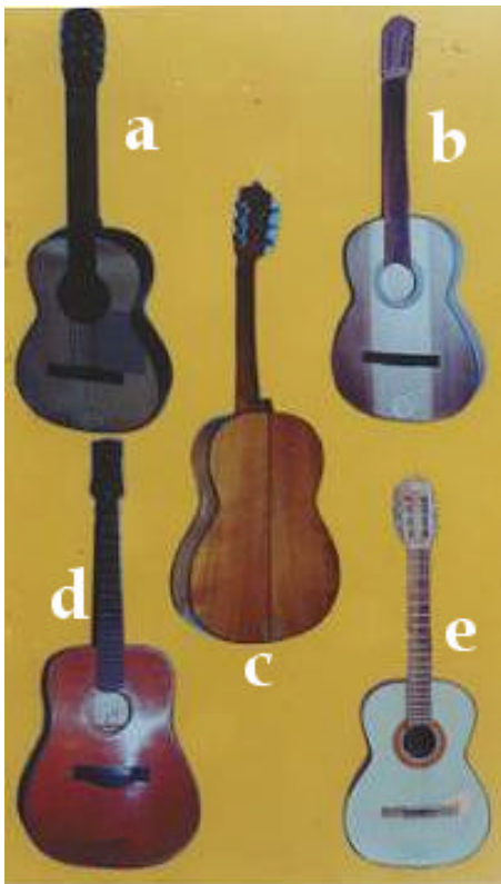
Fig. 7. Tipos de guitarra. a. Clásica. b. Flamenca. c. Popular. d. Texana. e. Escenografía.

que con el pulgar se frota la sexta cuerda y ocasionalmente la quinta, se une al cuerpo en el traste 14, la cabeza es más grande con las clavijas de mayor peso, el diseño de las barras armónicas es en forma de X, el puente es más grande, colocado más cerca de la boca y con la ceja inclinada. La tapa y las barras son de Thuja (Wester redcedar). El fondo y las costillas son de Juglans (Nogal). El brazo de Cedrela (Cedro). El diapasón, el puente y el alma son de Platymiscium (Granadillo). Las cuerdas son de metal. La tapa se barniza en tonos rojizos y el fondo y las costillas en tonos oscuros. Los adornos son de madera o plástico, en la roseta se alternan círculos blancos y negros (Fig. 7d).