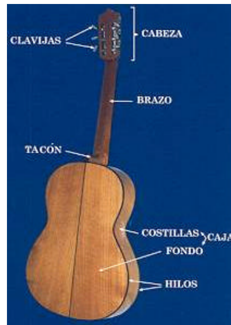
Fig. 3. Vista posterior de la guitarra.

NART (Fondo Nacional Para el Fomento de las Artesanías) en el Distrito Federal. Se obtuvieron datos de los diferentes tipos de guitarras, el nombre de cada una de sus partes, las herramientas que ocupan, la madera que utilizan y su abastecimiento. En Paracho además de los talleres, se conoció un aserradero donde inicia el proceso de la madera nacional y una fábrica de guitarras.