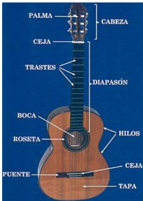
Fig. 2. Vista anterior de la guitarra.