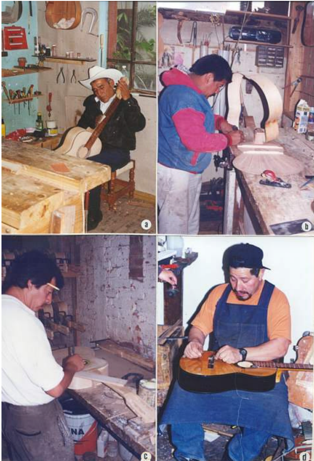
Fig. 8. Elaboración de la guitarra. a. Taller. b. Costillas. c. Pegado del diapasón. d. Encordado.