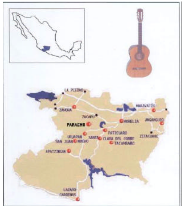
Fig. 1. Municipio de Paracho, Michoacán, México.

Tanto su forma como el número de cuerdas ha cambiado a través del tiempo, adaptándose a las necesidades de la música que se interprete.